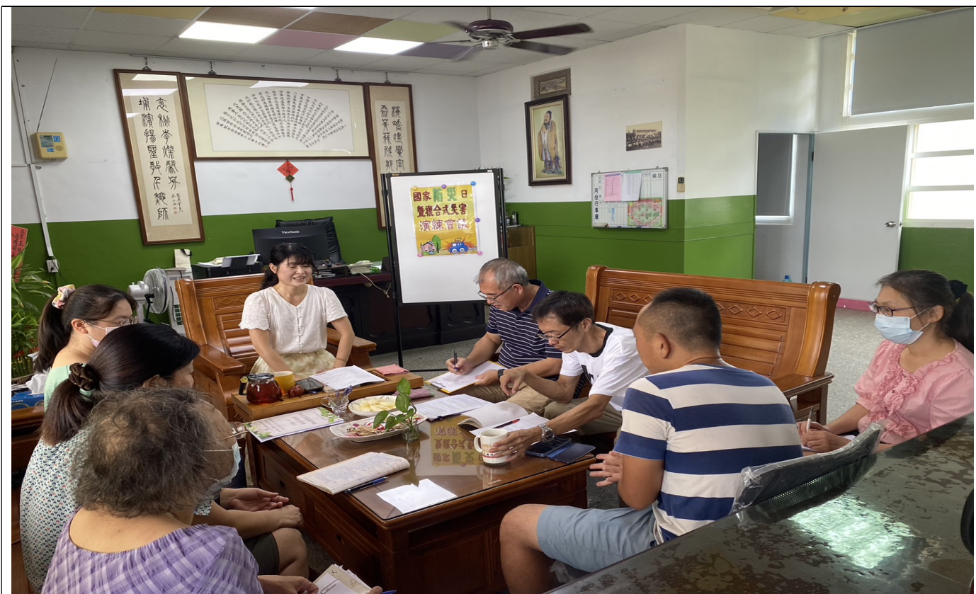
說明：校長主持校園演練計畫編訂。