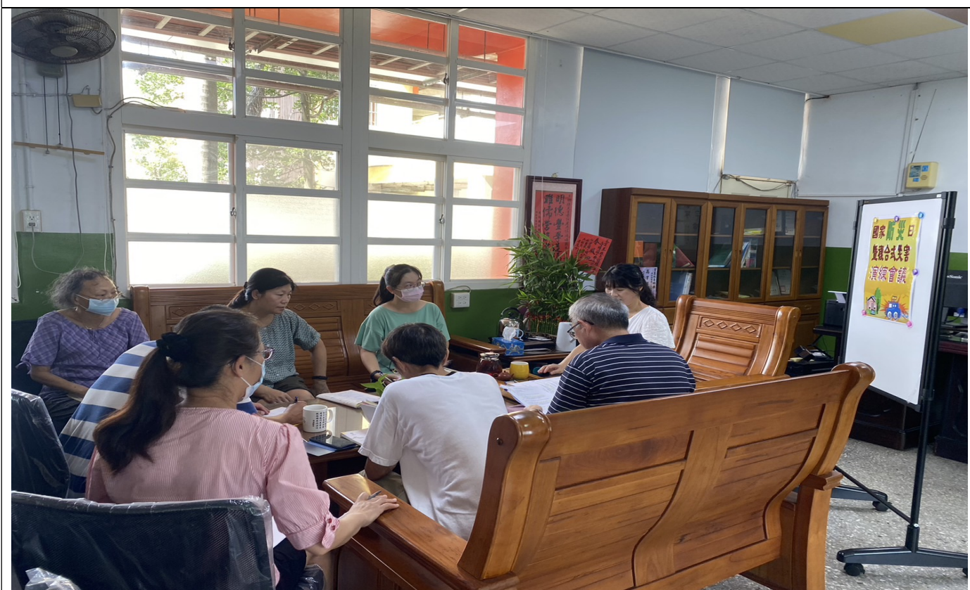
說明：學校同仁利用晨會協同修正校園演練計畫之情形。